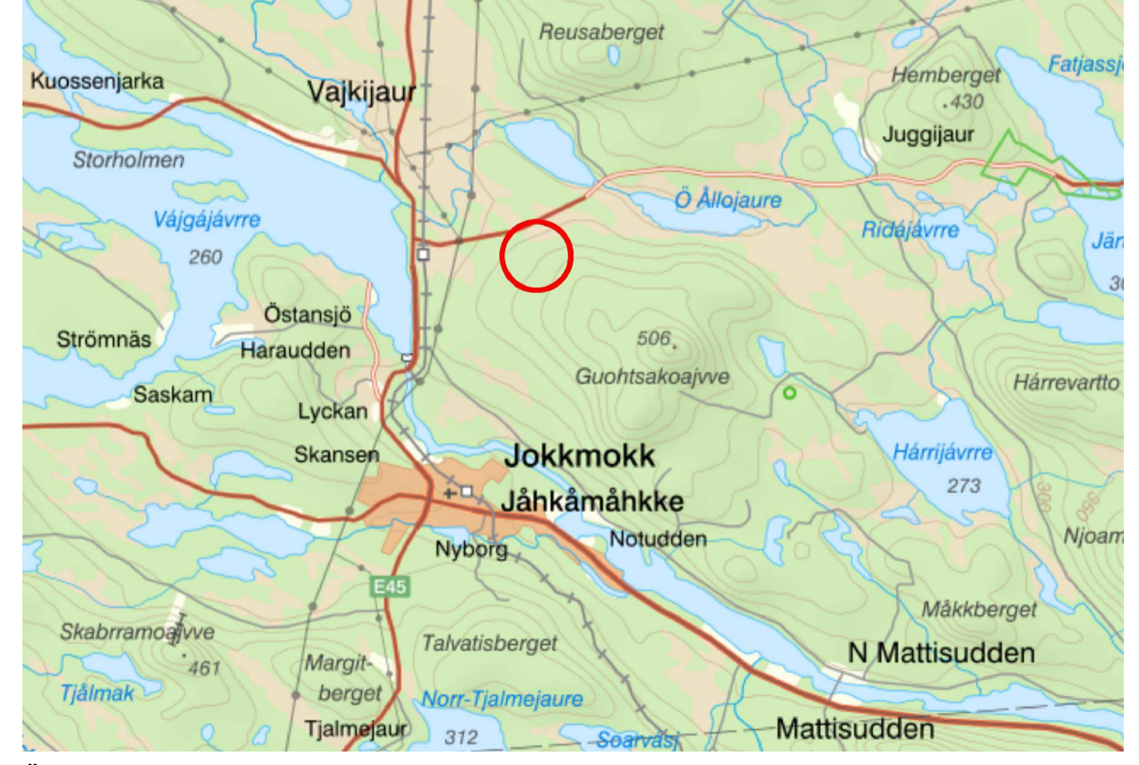
Översiktskarta (ej skalenlig)

Normalt förfarande Upprättad enligt PBL 2010:900 i lydelse efter den 1 januari 2015