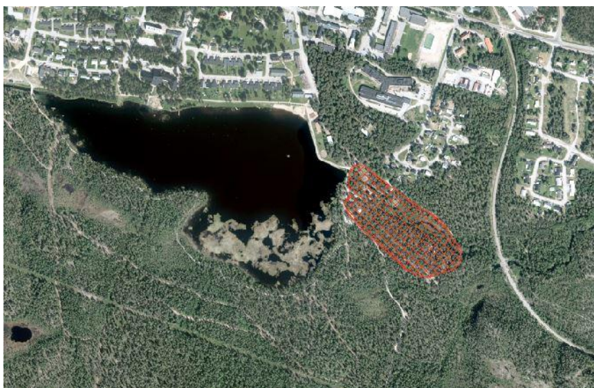
Karta visar planområdets ungefärliga utbredning

Tilltänkta planområde är beläget öster om Talvatissjön, i Jokkmokks kommun, och omfattar delar av fastigheterna Jokkmokk 10:40, 10:43 och Kyrkostaden 1:2 med en areal på ca 5 hektar. Nuvarande fjällträdgården kommer att ingå som en del.