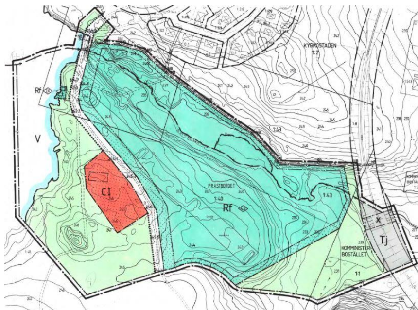
Gällande stadsplan för del av fastigheten Prästbordet 1:40 m.fl., 1985, 25-P85/49