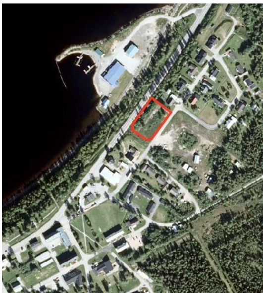
Karta visar planområdets lokalisering inom Porjus